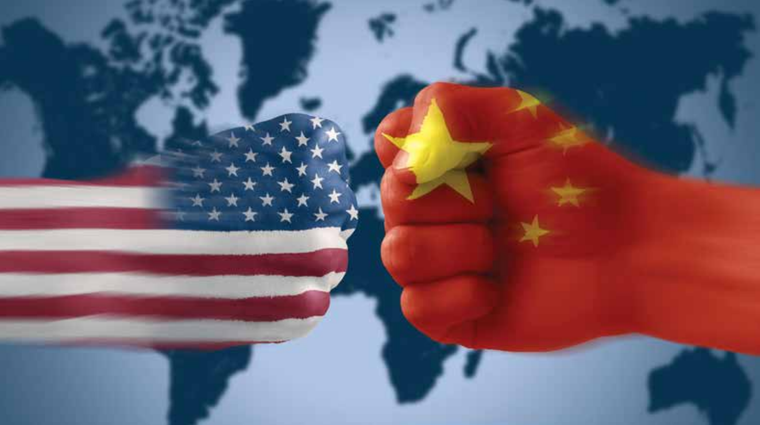
כלי הנשק במלחמה הכלכלית בין סין לארצות הברית: פרויקטי ענק ופיתוח אזורי